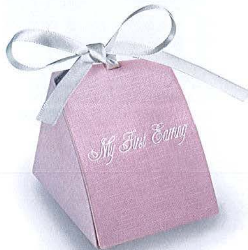
Ein Geschenkgutschein und die Aufbewahrungsbox sind weitere Zutaten für den Erfolg der Aktion „My first Earring“

dem umfangreichen Programm kann sich der Juwelier profilieren. Die Designs werden den Bedürfnissen von Kindern und Eltern gleichermaßen gerecht. Ohrstecker in Blümchenform sind beim jungen Publikum zurzeit besonders beliebt. Sie sind auch in 585 Echtgold erhältlich, außerdem gibt es Ohrstecker in 750 Echtgold. Axel Henselder www.studex.com