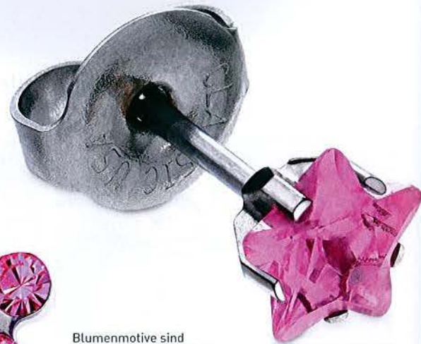
Blumenmotive sind bei den jungen Kundinnen derzeit der Renner