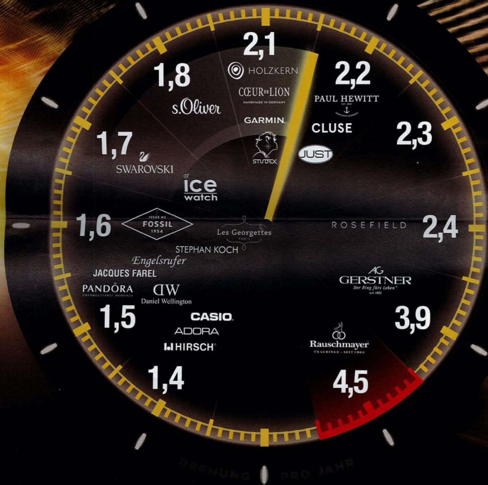
Dies sind die Drehwunder 2019: Gezeigt werden Marken und Lieferanten, die beim Juwelier eine überdurchschnittlich hohe Lagerdrehung erreichen konnten.

Die Drehwunder 2019 sind die Marken und Lieferanten, die beim Juwelier eine überdurchschnittlich hohe Lagerdrehung erreichen konnten. Die Drehwunder 2019 sind die Marken und Lieferanten, die beim Juwelier eine überdurchschnittlich hohe Lagerdrehung erreichen konnten.